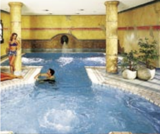
Lindner Hotel Wiesensee in Westerburg