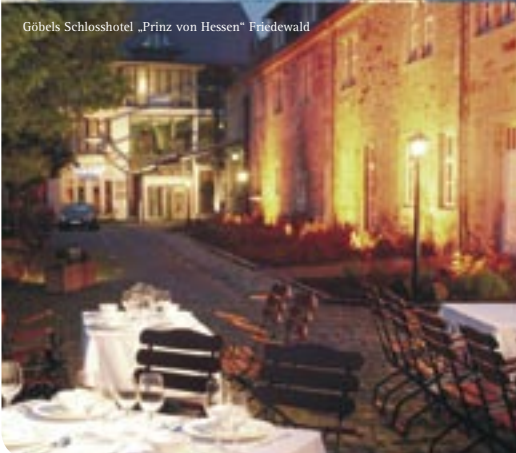
Göbels Schlosshotel „Prinz von Hessen“ Friedewald